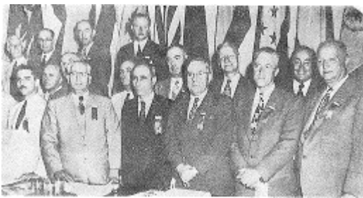
Delegados de Argentina, Uruguay, Honduras, Cuba, El Salvador, Brasil, Canadá, EEUU, en la sesión inaugural 1era Convención, La Habana.

Se determinó en 1951, que la Sede de UPADI se establecería en Montevideo, Uruguay durante los primeros años.